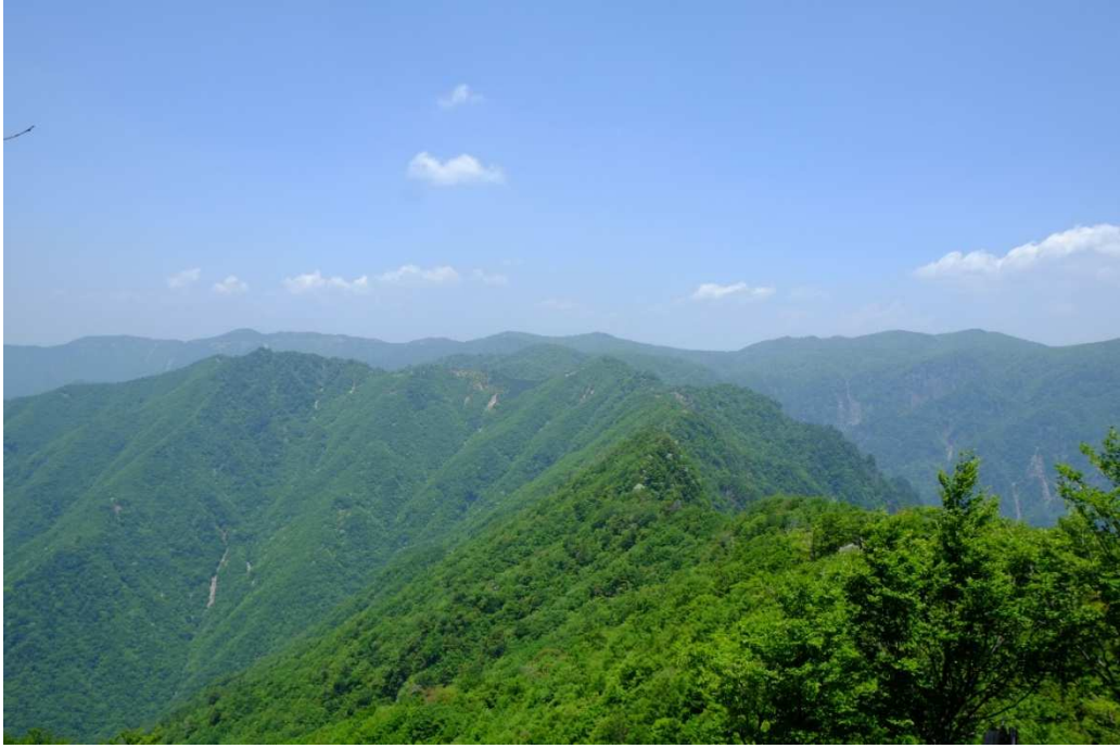
「又劔山」から見る竜口尾根と大台ヶ原（右）