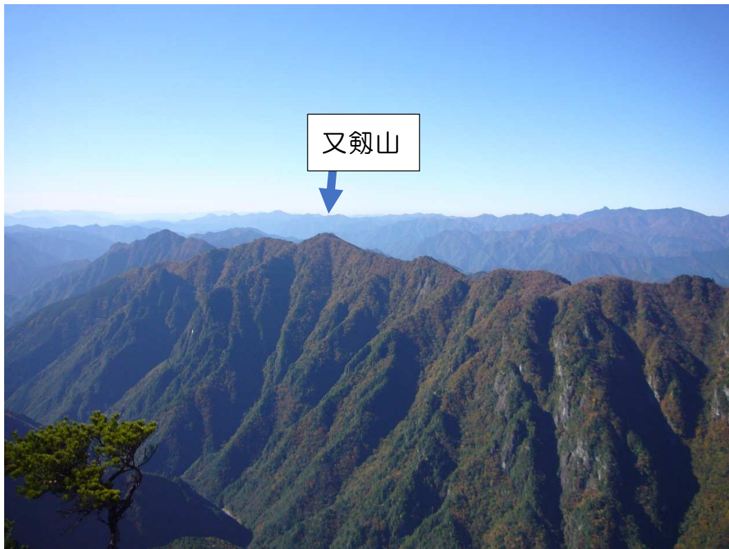
大台ヶ原「大蛇峠」から見る「又劔山」

昼食後は車で東ノ川流域の滝へ。「大鍋・小鍋の滝」、「不動滝・銚子滝」は道路端からの眺望、「かくれ滝」は道路から歩いて 5 分で滝壺まで行けます。